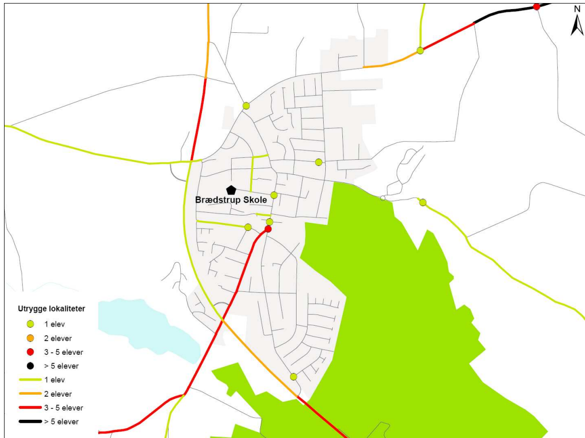
Figur 3. Samtlige elevers angivelse af farlige og utrygge steder på veje og stier omkring Brædstrup Skole.

Udpegningen af utrygge lokaliteter omkring Brædstrup Skole viser, at der er få lokaliteter, der opfattes som utrygge.