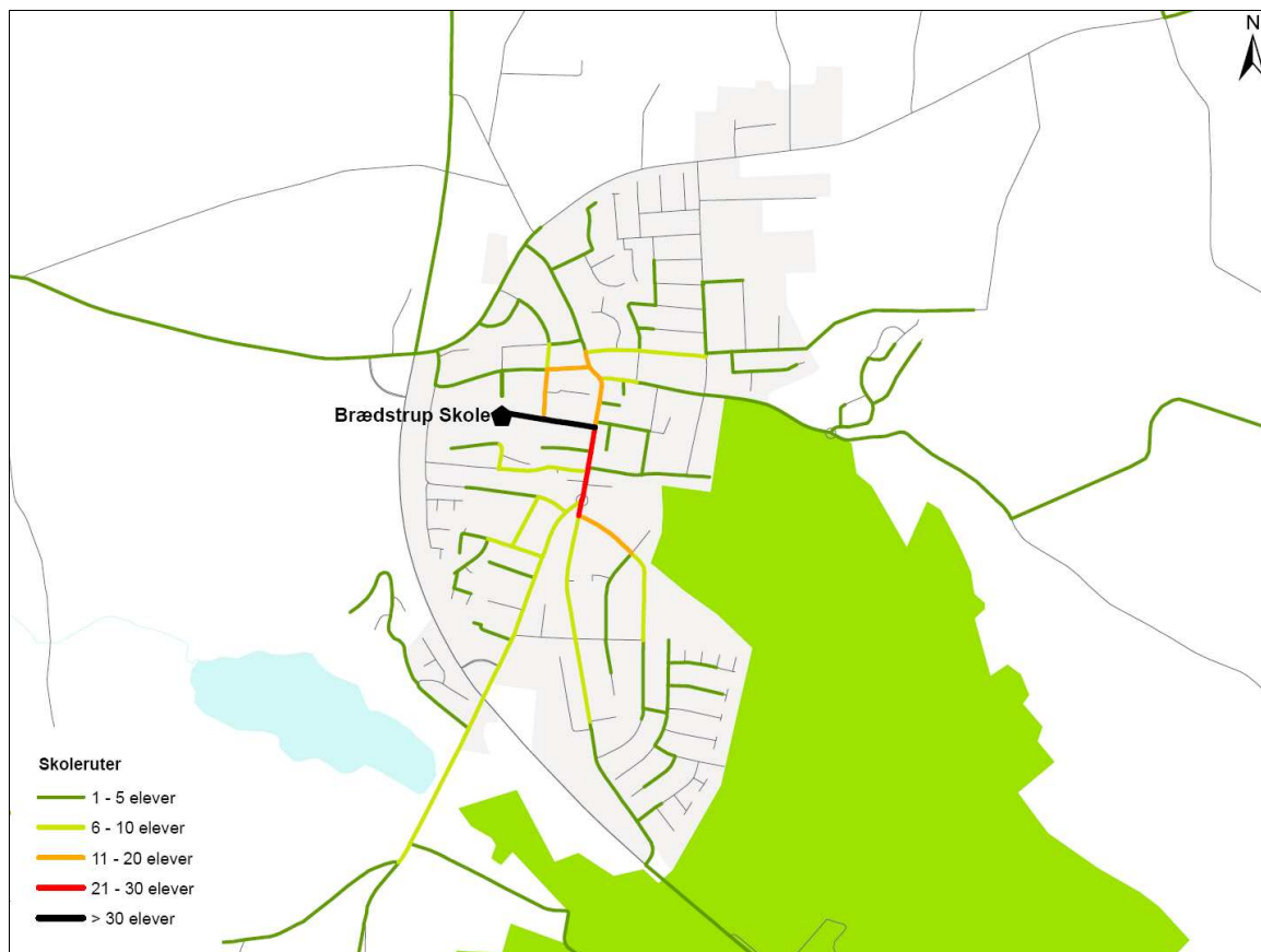
Figur 2. Udpejning af ruter til og fra skole for de gående og cyklende omkring Brædstrup Skole.

På efterfølgende figur ses de ruter til og fra skole som de gående og cyklende elever har udpeget omkring Brædstrup Skole.