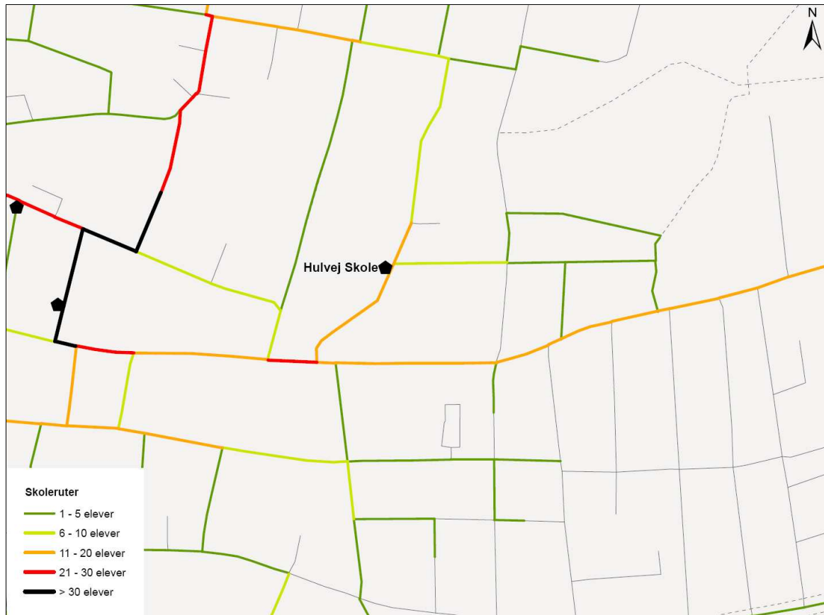
Figur 2. Udpegning af ruter til og fra skole for de gående og cyklende omkring Hulvej Skole.

Kortet viser endvidere de ruter, som nogle elever på de naboliggende skoler anvender.