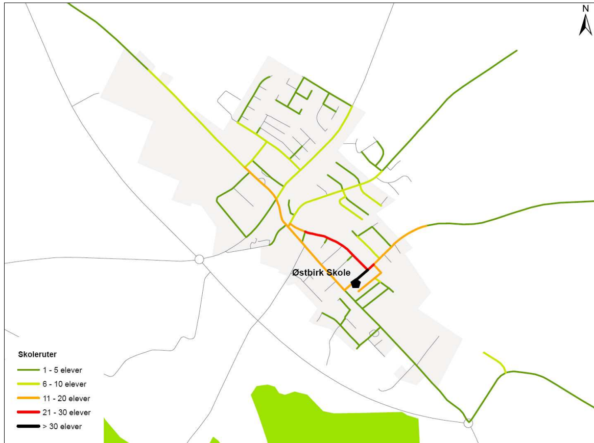
Figur 2. Udpeging af ruter til og fra skole for de gående og cyklende omkring Østbirk Skole.

På efterfølgende figur ses de ruter til og fra skole som de gående og cyklende elever har udpeget omkring Østbirk Skole.